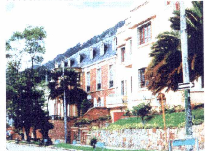
ALTERACIONES A LA EDIFICACION ORIGINAL VISIBLES DESDE EL EXTERIOR :